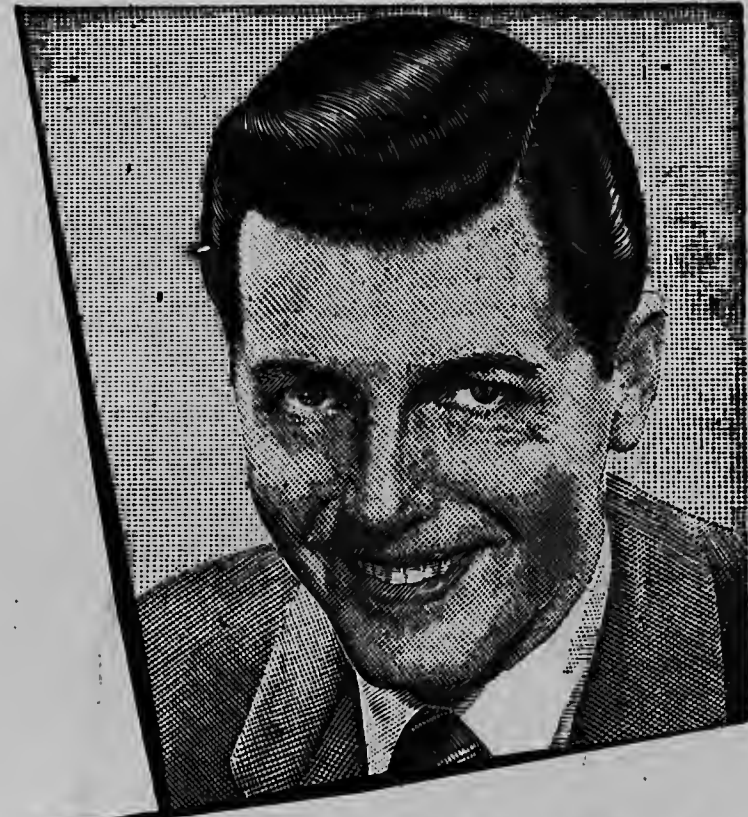
Mannen die „gezien” zijn, prefereren

dat zij had geschreven dat de kassier van de Surinaamse Bank te Nickerie bij de a.s. verkiezingen kandidaat der VHP zou zijn. Tenzij het blad dit rectificeerde zou hij in de Staten de bevolking aanraden De Tijd niet meer te lezen. Hij zou het blad breken en noemde een redactielid dat hem te woord stond: schurk. „Het wordt voortdurend fraaier” zo voegt Het Nieuws aan dit bericht toe.